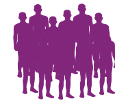
une centaine de patients

Étudier la tolérance de l'organisme et les effets secondaires ; transformé et éliminé par le corps ; auxquels le médicament montre des signes d'efficacité tout en entraînant le moins d'effets secondaires.