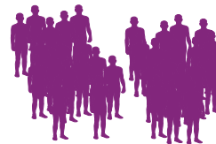
des centaines à des milliers de patients, divisés en deux groupes par tirage au sort (randomisation)

et le protocole d'administration du médicament est le plus efficace.