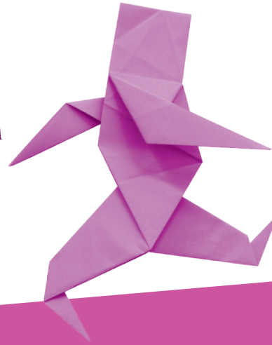
© Naomiki Sato / June Maekawa

Pr Pierre B Chef du service d'hématologie clinique de l'hôpital Avicenne à Bobigny (université Paris 13)