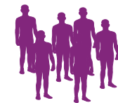
50 personnes maximum

Avant de devenir une option thérapeutique, un médicament est systématiquement étudié chez l'homme, dans le cadre de plusieurs essais correspondant à différentes « phases ». À chaque étape, l'essai peut s'arrêter si le nouveau traitement ne répond pas aux objectifs fixés. Un même patient ne participe pas à toutes les phases car les critères de participation changent d'une étape à l'autre.