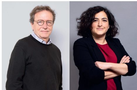
Pr Éric Solary