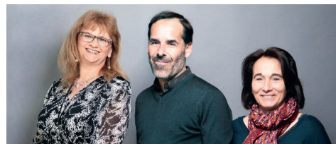
Service Relations Donateurs

déduire 66% du montant de vos dons de votre Impôt sur le Revenu (ou 75% de vos dons de votre Impôt sur la Fortune Immobilière si vous en êtes redevable). Pour toute question, n'hésitez pas à contacter notre service Relations Donateurs par téléphone au 01 45 59 59 09 ou par mail à donateurs@fondation-arc.org .